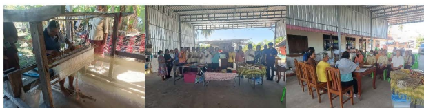
(มีวีดิทัศน์ส่งเสริมอุตสาหกรรมที่ ๕ พารามชนออกแบบสวนน้ำในน)