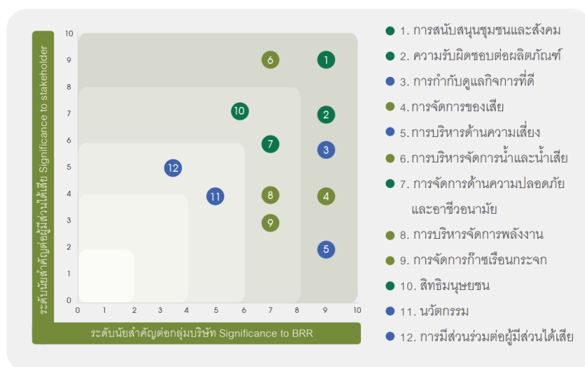
รูปภาพประเด็นสำคัญด้านความยั่งยืนขององค์กร