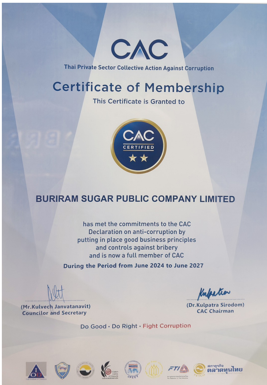
4.1 รูปภาพการเข้าร่วมเครือข่ายในการต่อต้านทุจริตและคอร์รัปชัน