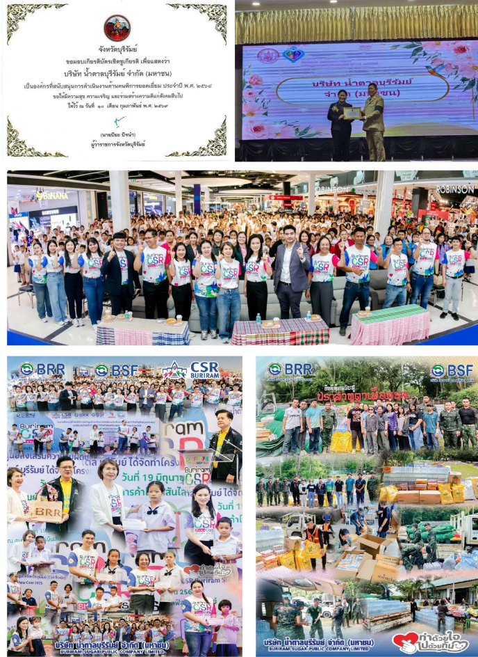
รูปภาพผลการดำเนินงานและผลลัพธ์ด้านการจัดการชุมชนและสังคม